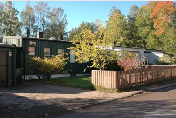
Den låga sidan upp mot sluttningen.