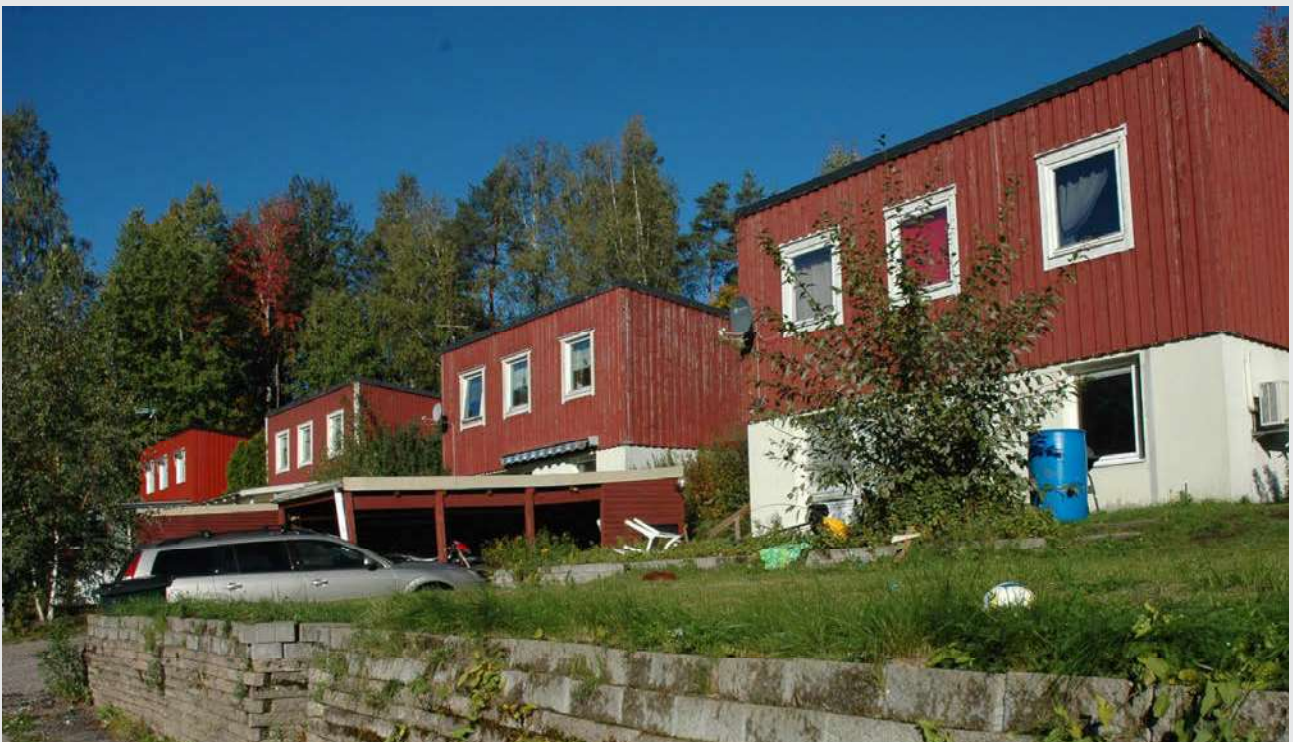
Den högre gatufasaden.