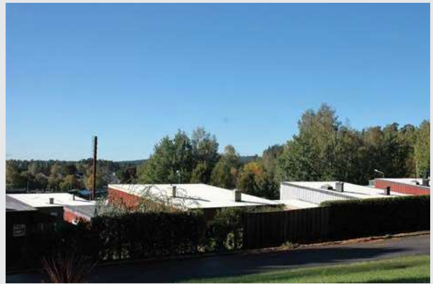
Den övre raden är inpassad i terrängen.