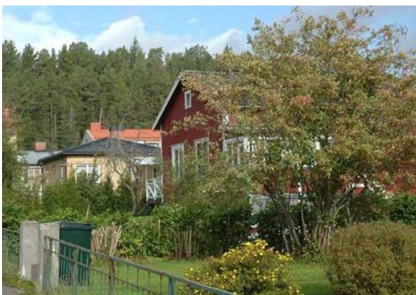
Små egnahemshus ligger indragna på tomten med förgårdsmark mot gatan.