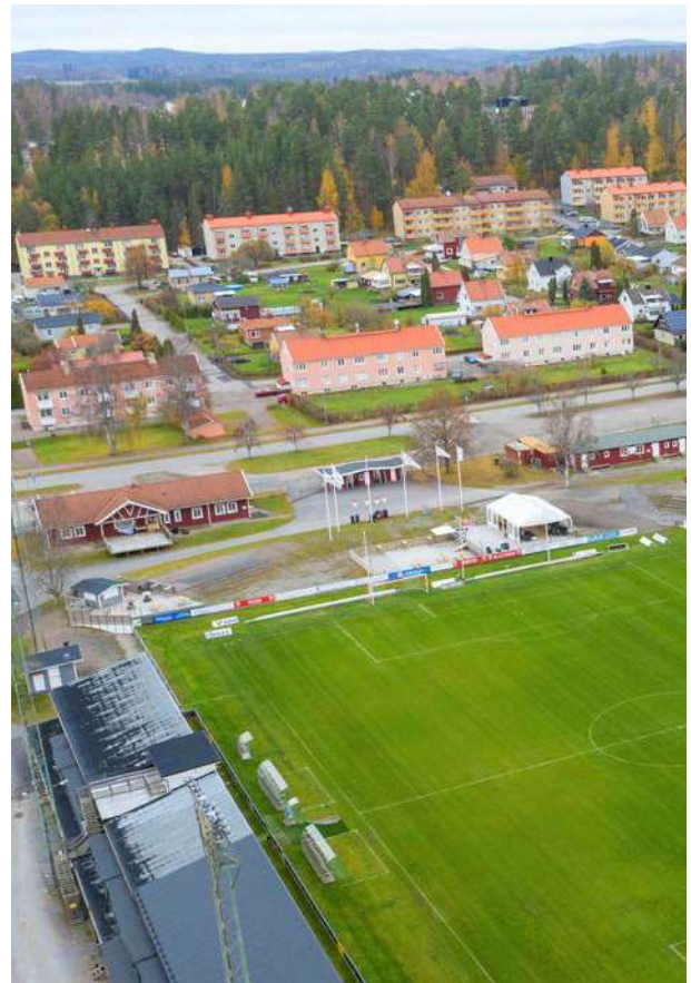
Stora Valla med fotbollsplan, flerbostadshus och egenhemsområde.