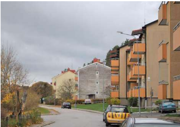
Mot nordväst avgränsas Stora Valla av en rad flerfamiljshus.

Utanför bostadsområdet, på marken mellan bostäderna och Letälven ligger Stora Valla Idrottsplats. Här finns förutom idrottshallar och flera fotbollsplaner också den historiska fotbollsplanen Stora Valla. Platsen har sitt ursprung i 1930-talet då de två rivaliserande fotbollslagen Jannelund SK och Degerfors slogs samman. Till fotbollsplanen hör förutom låga och relativt sent tillkomna envåninga byggnader också en öppen läktare och ett entréparti,