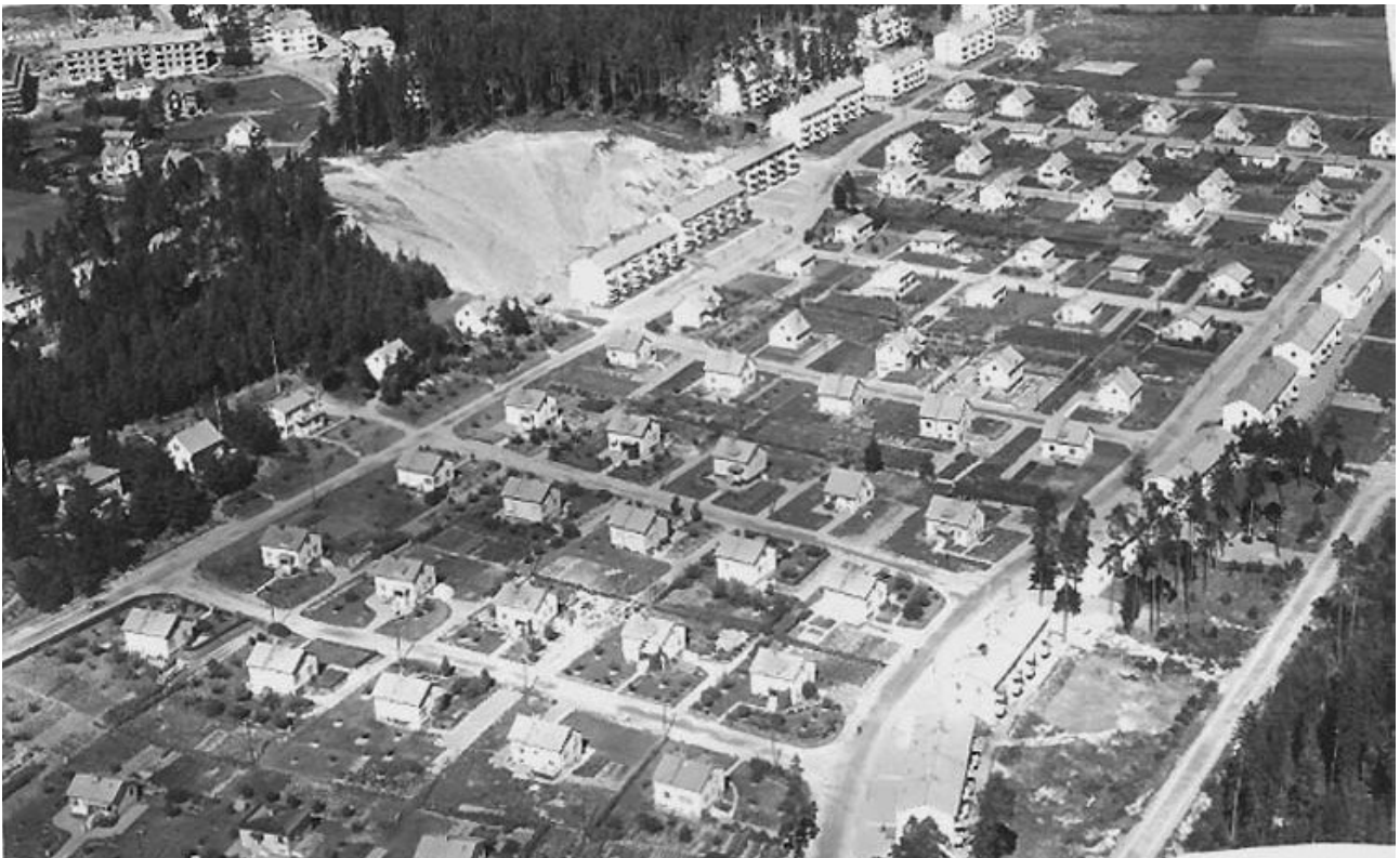
När Stora Valla var ungt. Här syns de ännu inte uppvuxna trädgårdarna i rutnätsplan. Högst upp syns sandtaget där material hämtades för att fylla ut kyrkogården inför utvidgningen.

Kommunens planer för området kompletterades senare och resulterade så småningom i det vi ser idag, ett egnahemsområde i en rutnätsplan omgärdat av flerbostadshus, skolbyggnader med idrottshall och en välkänd idrottsanläggning. Villorna placerades med några meters förgårdsmark där häckar ramade in gatan. Tre rum och kök var en vanlig storlek på villorna och ett stort steg för en familj som flyttade från de enkla arbetarlängorna till ett helt eget hem. Tegelhus förekommer i området, men vanligast är träfasader. Panelerna målades med linoljefärg i kulörer som var populära för tiden, alltså dämpade pastelltoner i gul,