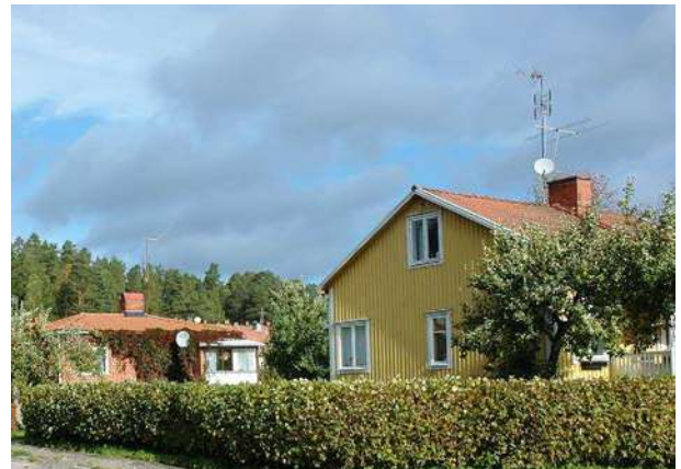
Inom området finns både hus i trä och tegel.