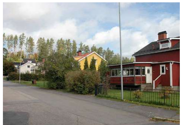
Egnahemshus med sadeltak, enkla detaljer och träfasader.