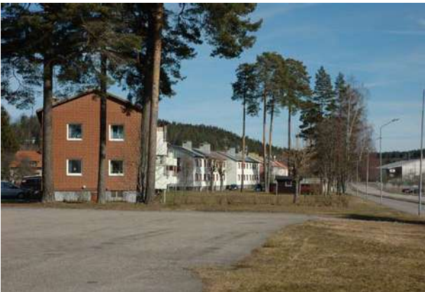
Flerbostadshus i södra Stora Valla.