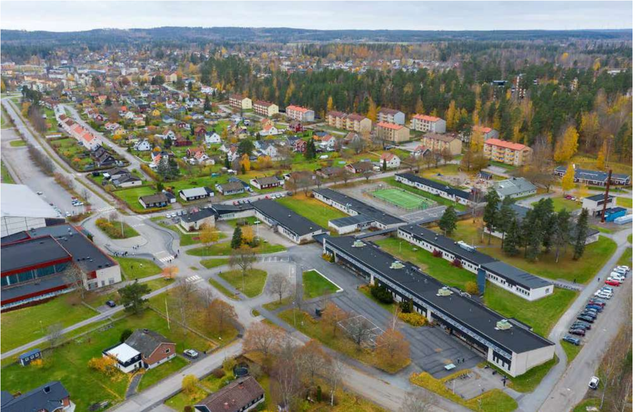
Stora Valla sett från ovan mot nordväst.