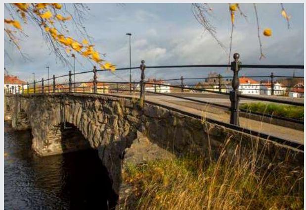
Bron över Letälven.