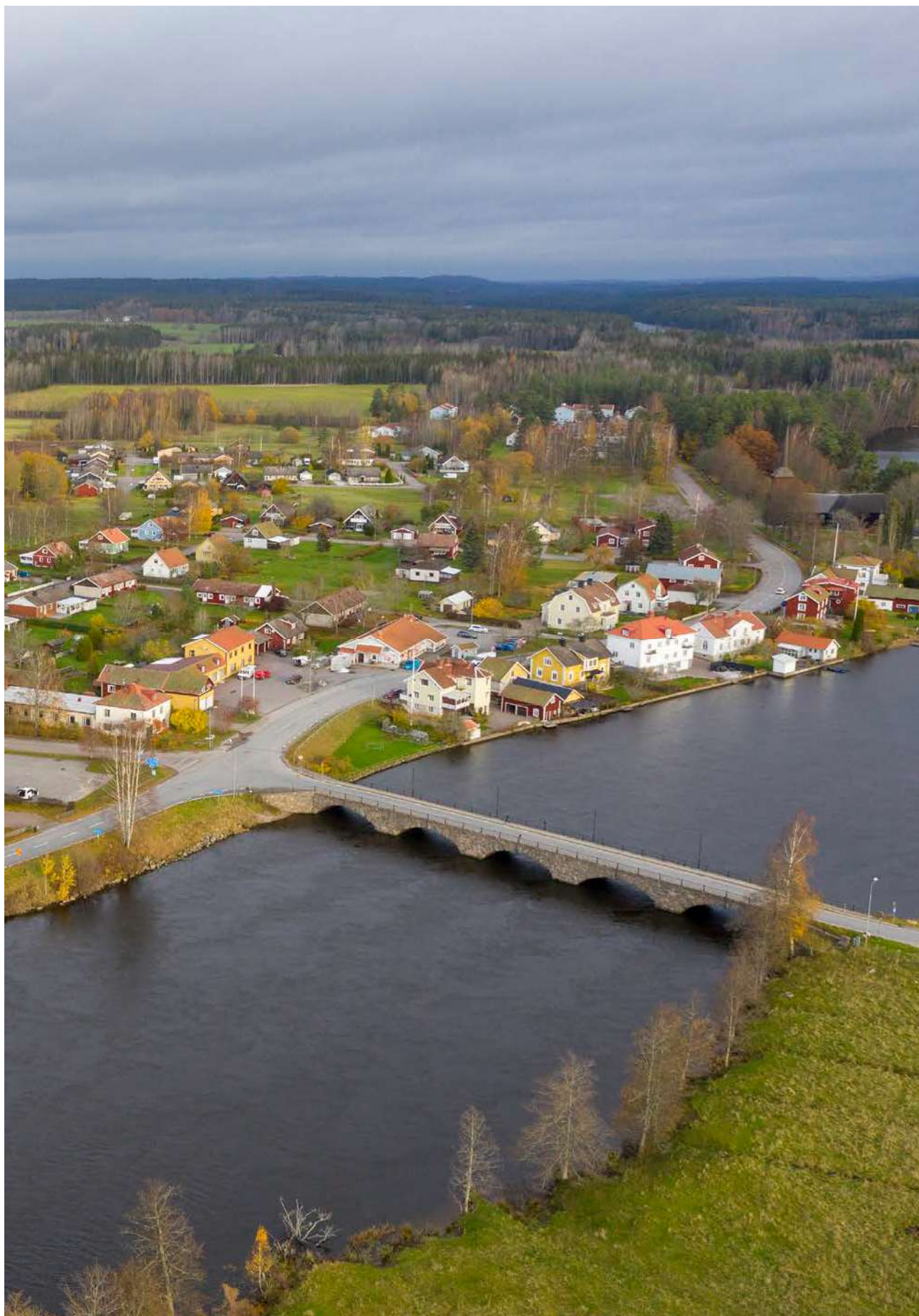
Flygfoto över Åtorp 2019.