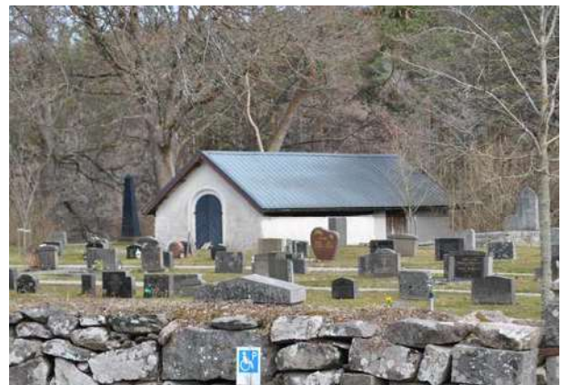
Bårhuset i kyrkogårdens södra del är troligen ett av de äldsta i stiftet.

Inom miljön finns också en gammal likbod som troligen är från sent 1700-tal eller tidigt 1800-tal. Dess ålderdomliga karaktär avspeglas i den låga volymen och murverket med ett par timrade varv under takfoten, åstaket och den gamla porten med stocklås. Exteriören har genom takets plåttäckning och tillbygge mot öster tillförts moderna material, men dessa är lätt urskiljbara från originalet. Även den mycket enkla interiören har en ålderdomlig karaktär med panelklätt och vitmålat tredingstak, bröstning samt trägolv med lucka.