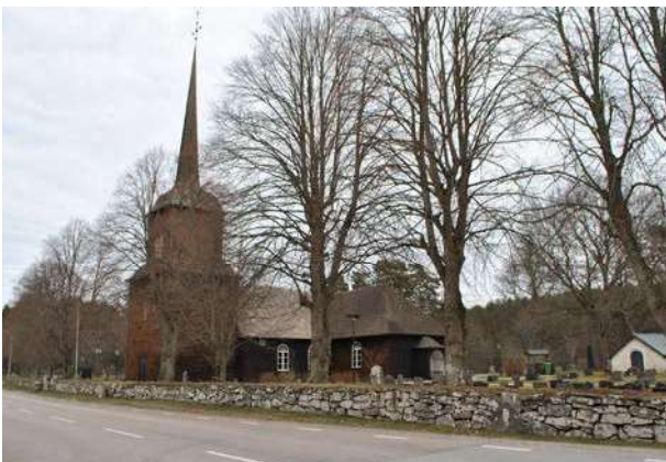
Nysunds kyrka fick sin nuvarande utformning 1735–40.