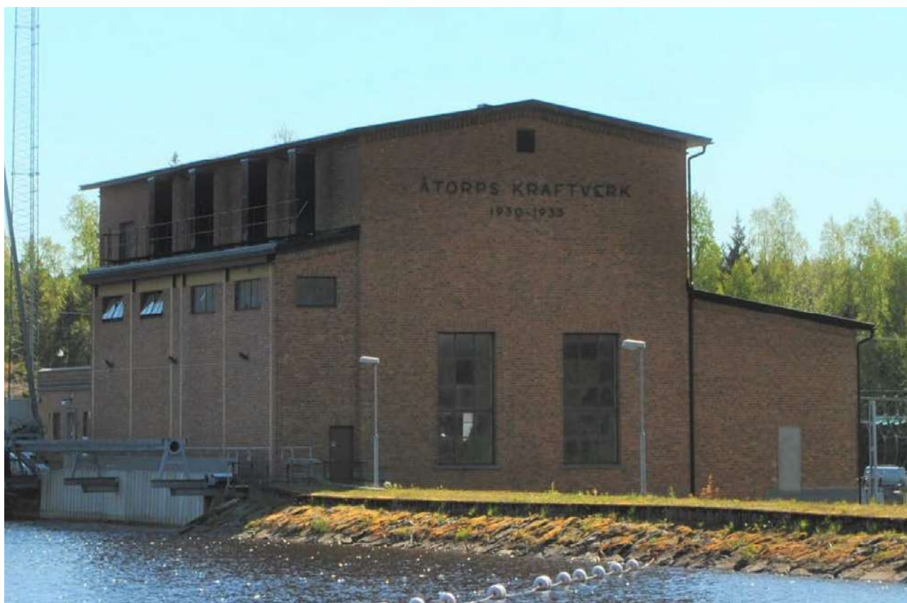
Kraftstationen strax söder om Åtorp.