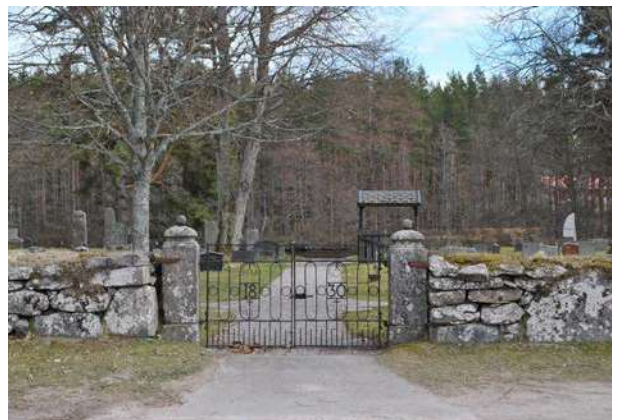
Grindarna i kyrkogårdsmuren bär året 1830.