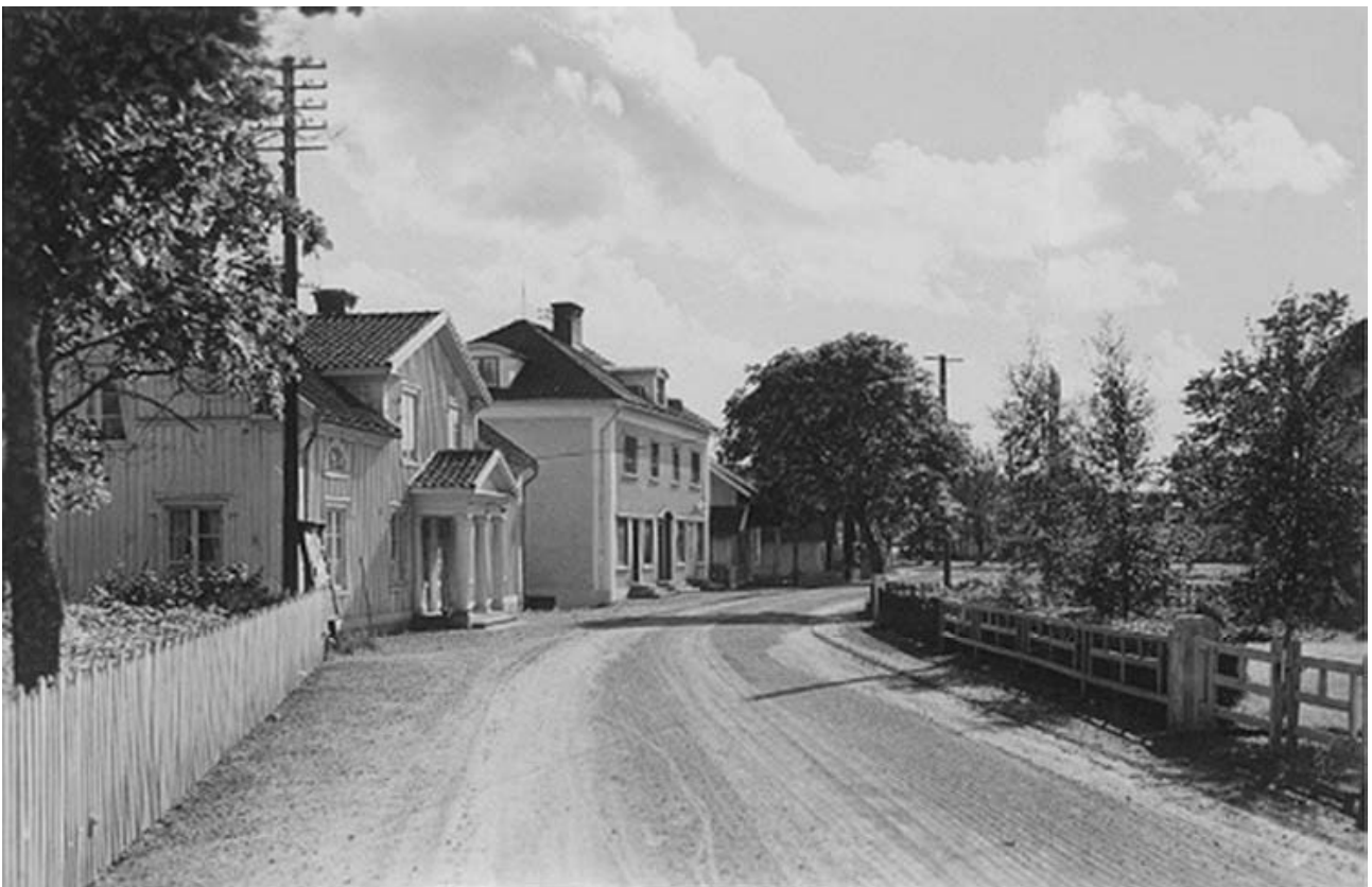
Lidetorpsvägen med kommunalhus och bank. Foto AB Flygtrafik, 1943. Bild från Digitalt museum, IDnr E9736CC0-2DC8-44E0-AE40-85262F67D10D.

Sedan sekelskiftet 1900 har det här också funnits olika frikyrkoförsamlingar. Den ena, metodisternas Betelkapell från 1910-talet, låg i en av byggnaderna längs Lidetorpsvägen. Här var mycket aktivitet med bland annat stor ungdomsverksamhet. I samma byggnad fanns också postkontoret fram till 1987, men av allt detta syns idag inga direkta spår. Missionskyrkans gamla Sionkapell ligger lite utanför det som var det direkta centrat. Den gamla kyrkan övergavs i samband med att den nya kyrkan uppfördes 1982. Brokyrkan samlar nu de två församlingarna under ett tak.