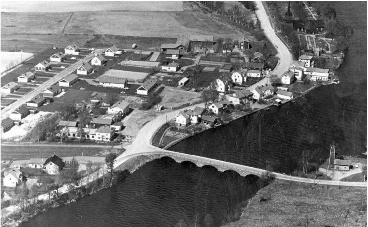
Flygfoto över Åtorp 1965. digitaltmuseum.se, 1325/1965; 3/38.

Åtorp fick sin första plan som omfattade centrum år 1960. I början av 1960-talet tillkom villabebyggelsen på Västervägen som bland annat uppfördes av AB Elementhus.